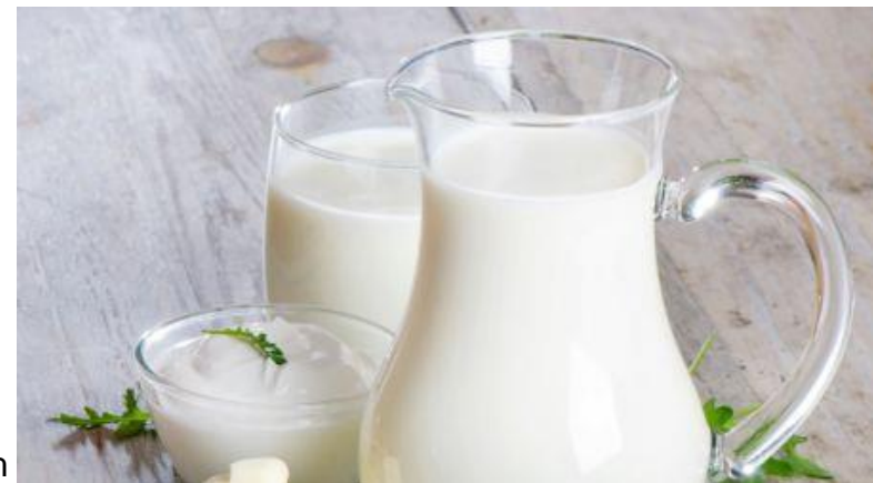
Abb. 4: Milch