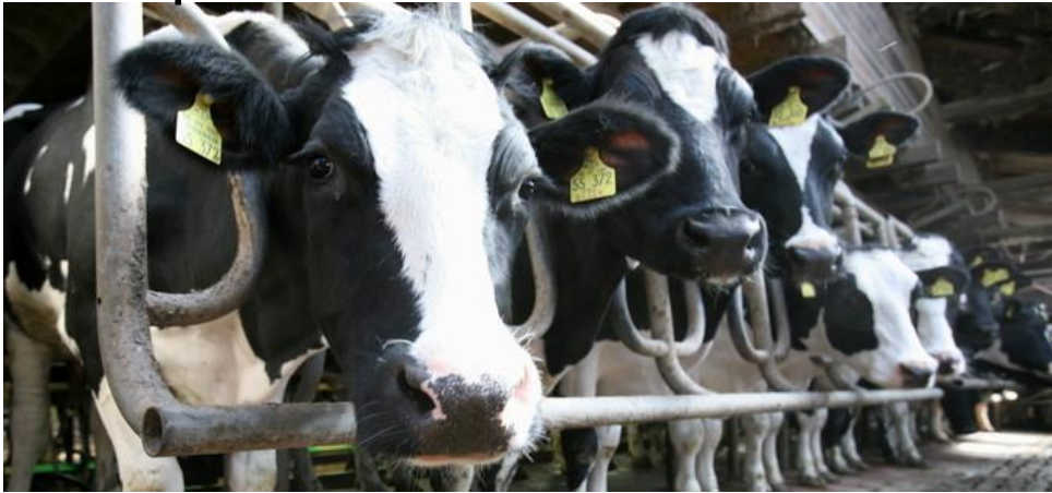
Abb. 3: Kühe im Stall

- zeigt die wichtigsten Zahlen und Fakten der Milchproduktion und Milchkonsum in Deutschland