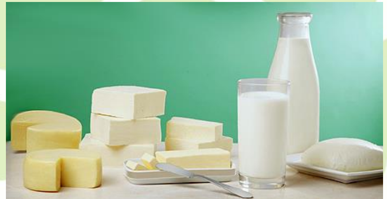
Abb. 1: Milchprodukte